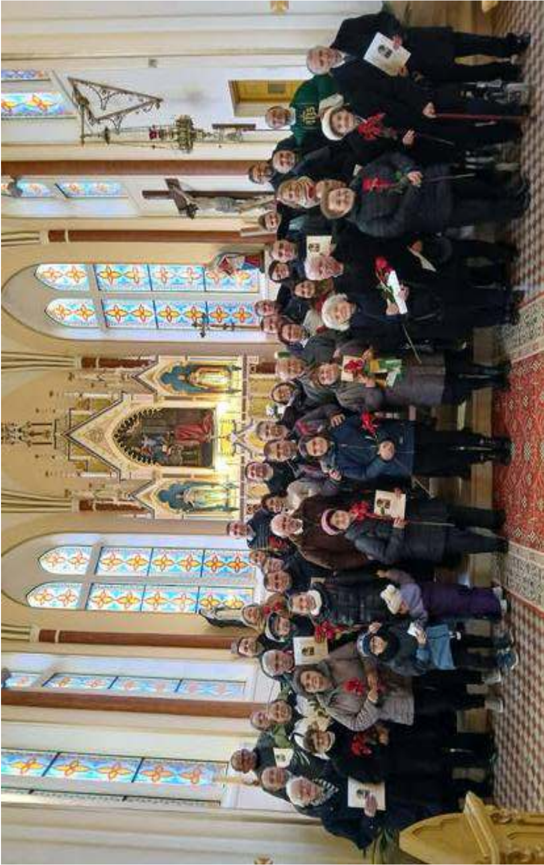
Jubiláns házaspárok megáldása 2026. 02. 15