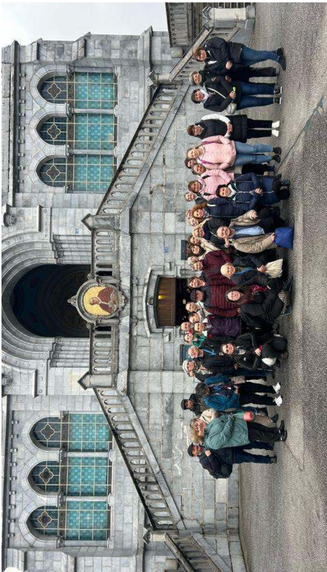
Lourdesi zárándoklat 2026. március 05-09