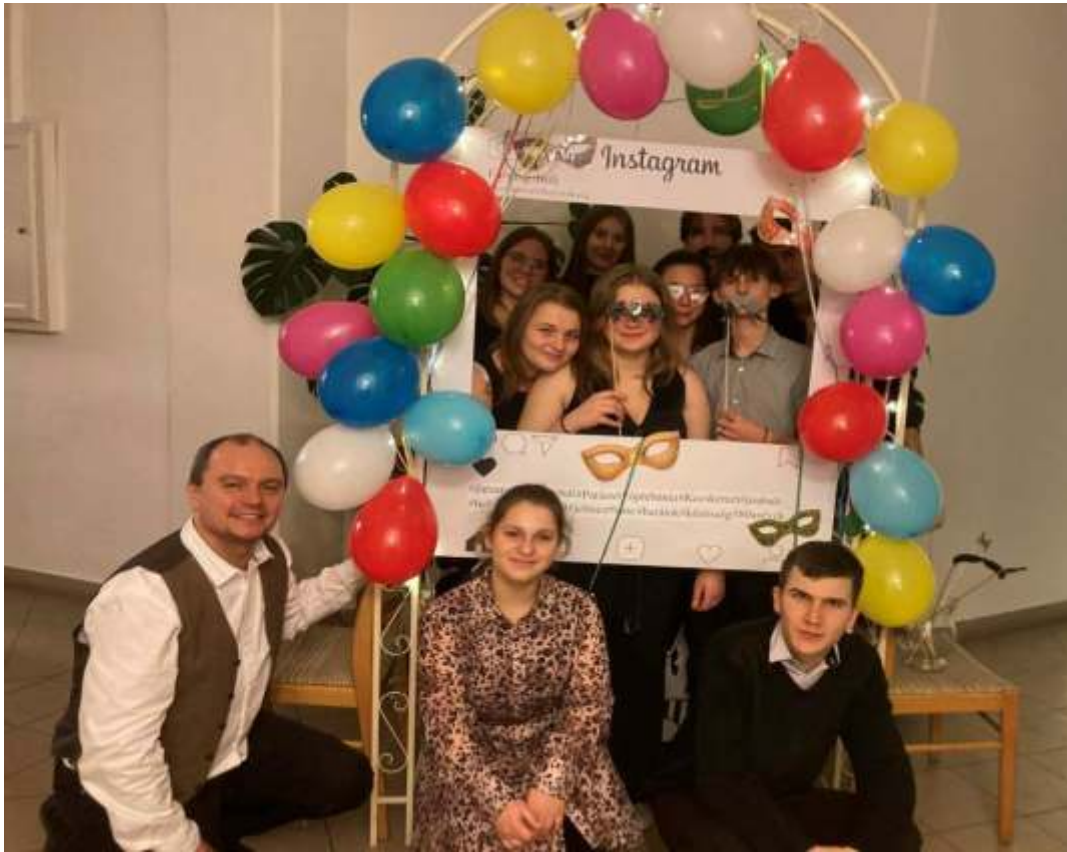
Egyházmegyei ifjúsági farsangi bál, Kecskemét 2026 február 14.