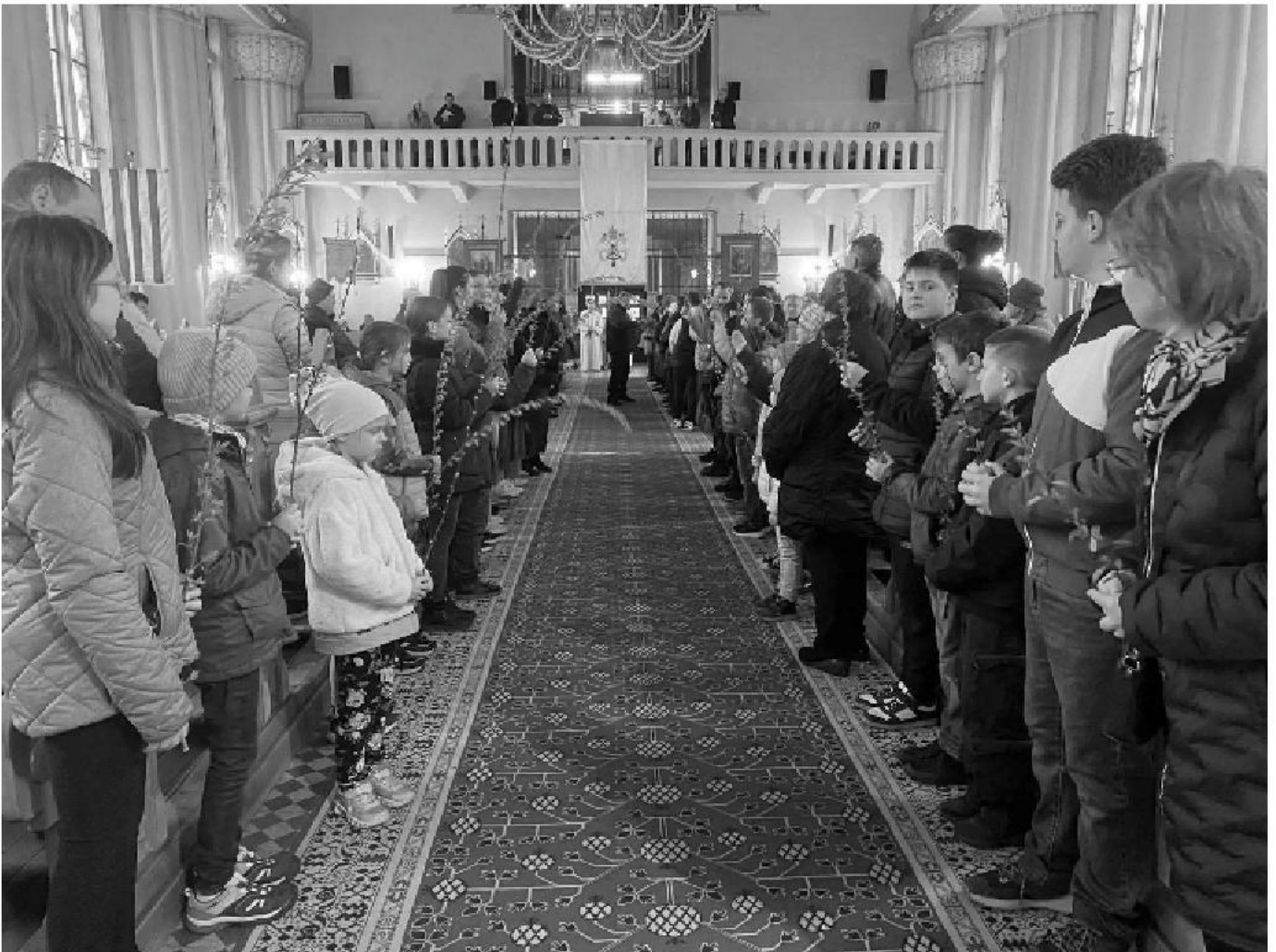
Virágvasárnapi bevonulás templomunkba 2026.03.29