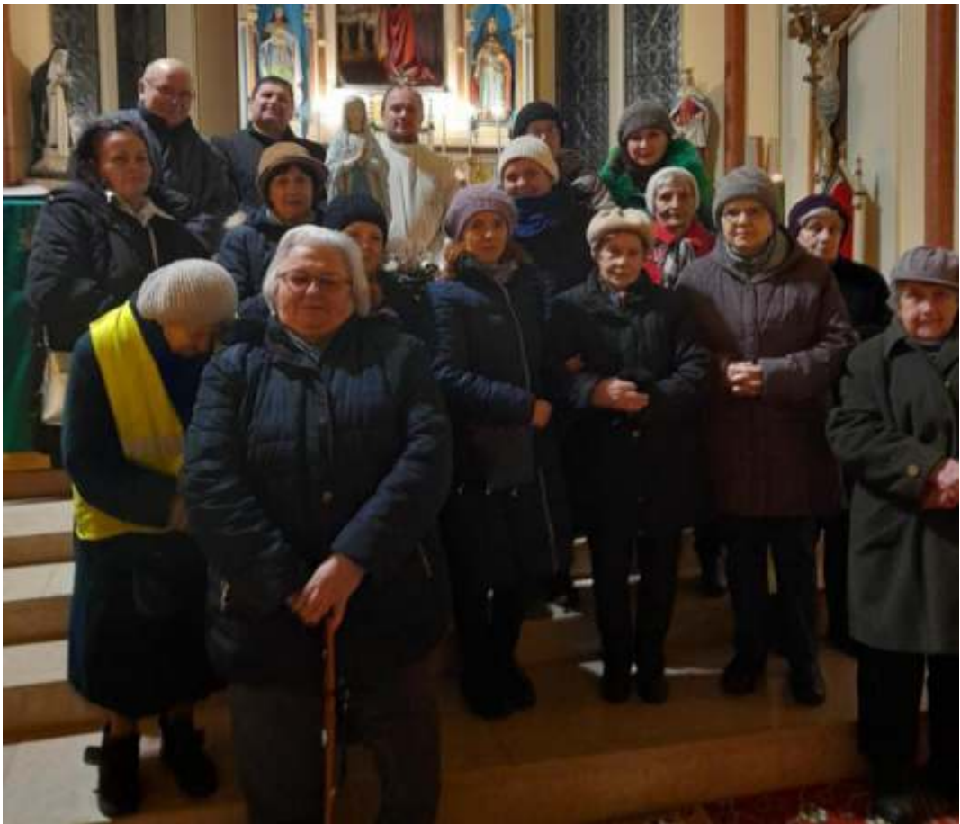
Lourdesi záró imaóra 2026 február 11.