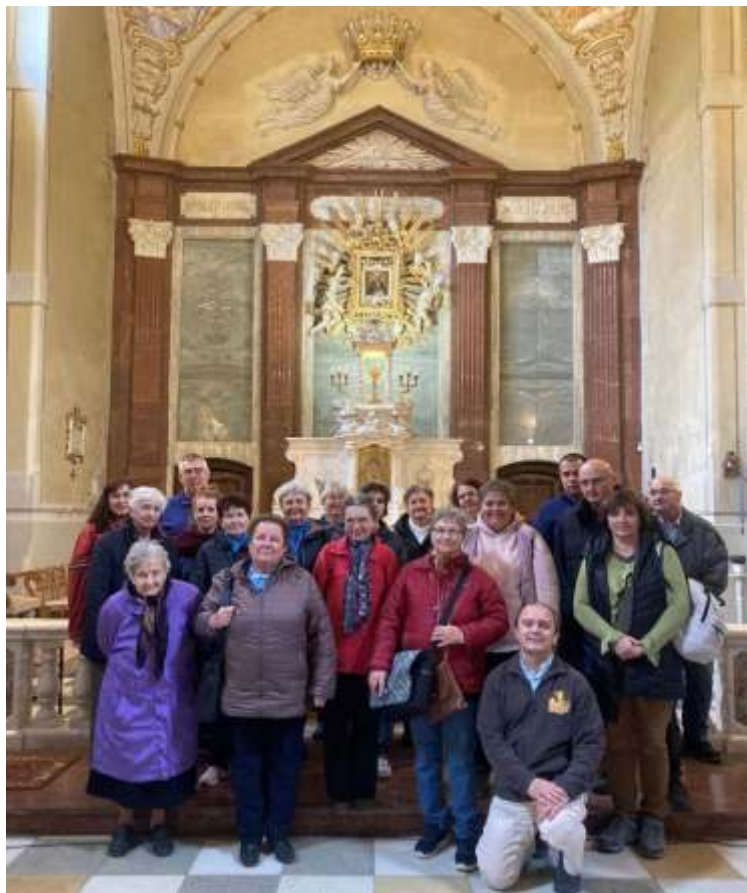
Október 23.-án Egyházközségi zarándoklaton Makkosmárián és az Anna-réti Engesztelő kápolnában imádkoztunk Egyházközségünkért, Településünkért, Magyar Hazánkért.