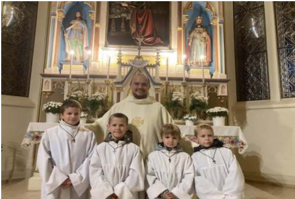
Szent Imre herceg, a Magyar ifjúság védőszentje. Könyörögj érettünk!