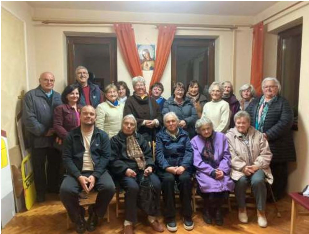
Rózsafüzér Társulatok Találkozója