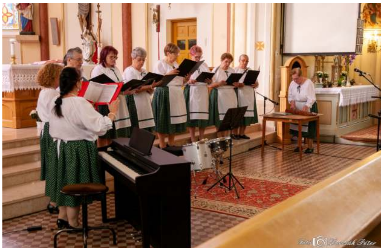
Tavaszi szél népdalkör