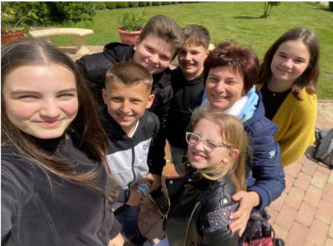
Hittanverseny résztvevői 2025.05.24 (részletek a 25. oldalon)