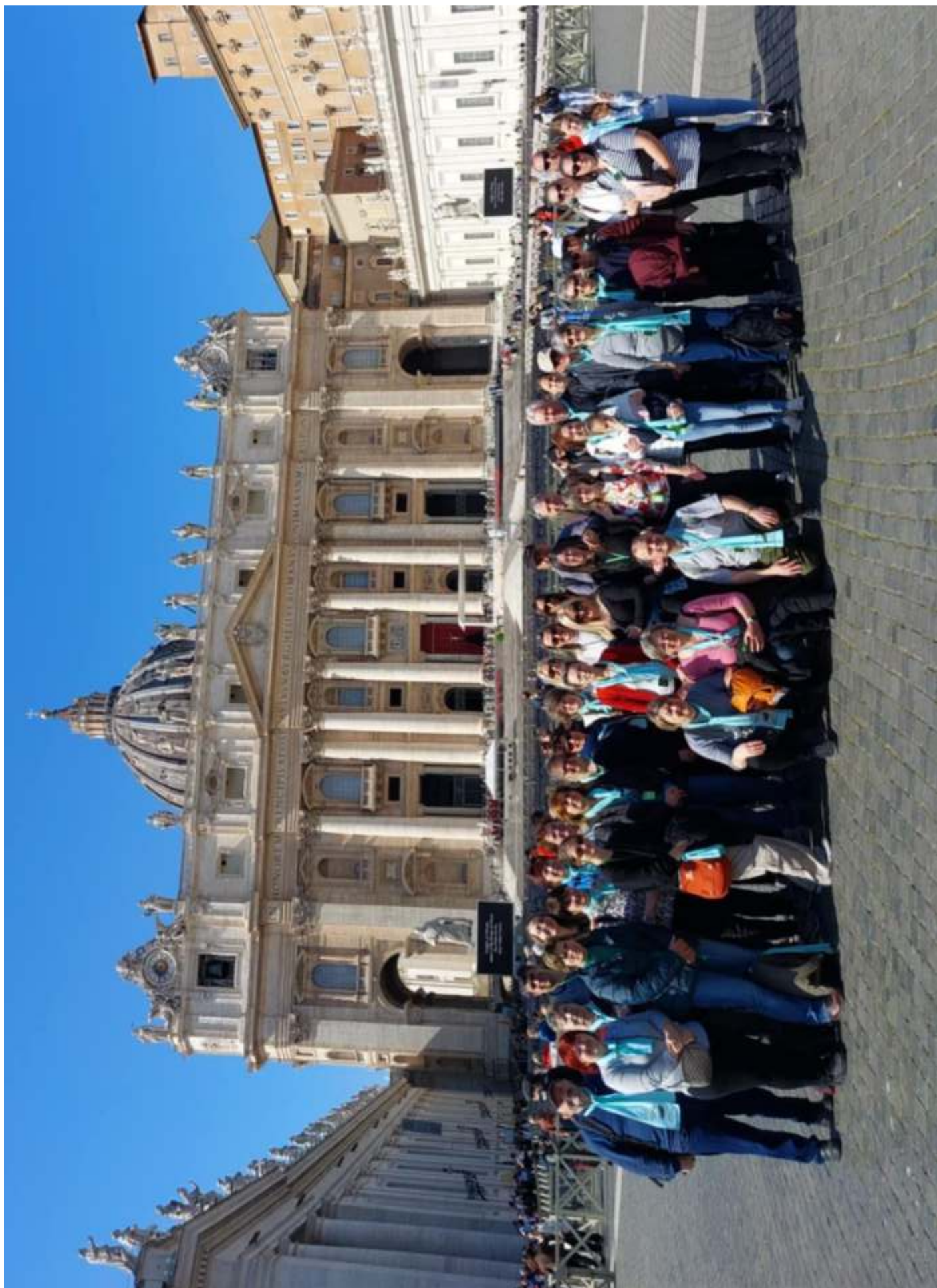
Római zarándoklat a keresztény örökség nyomában 2025.03.06-09.