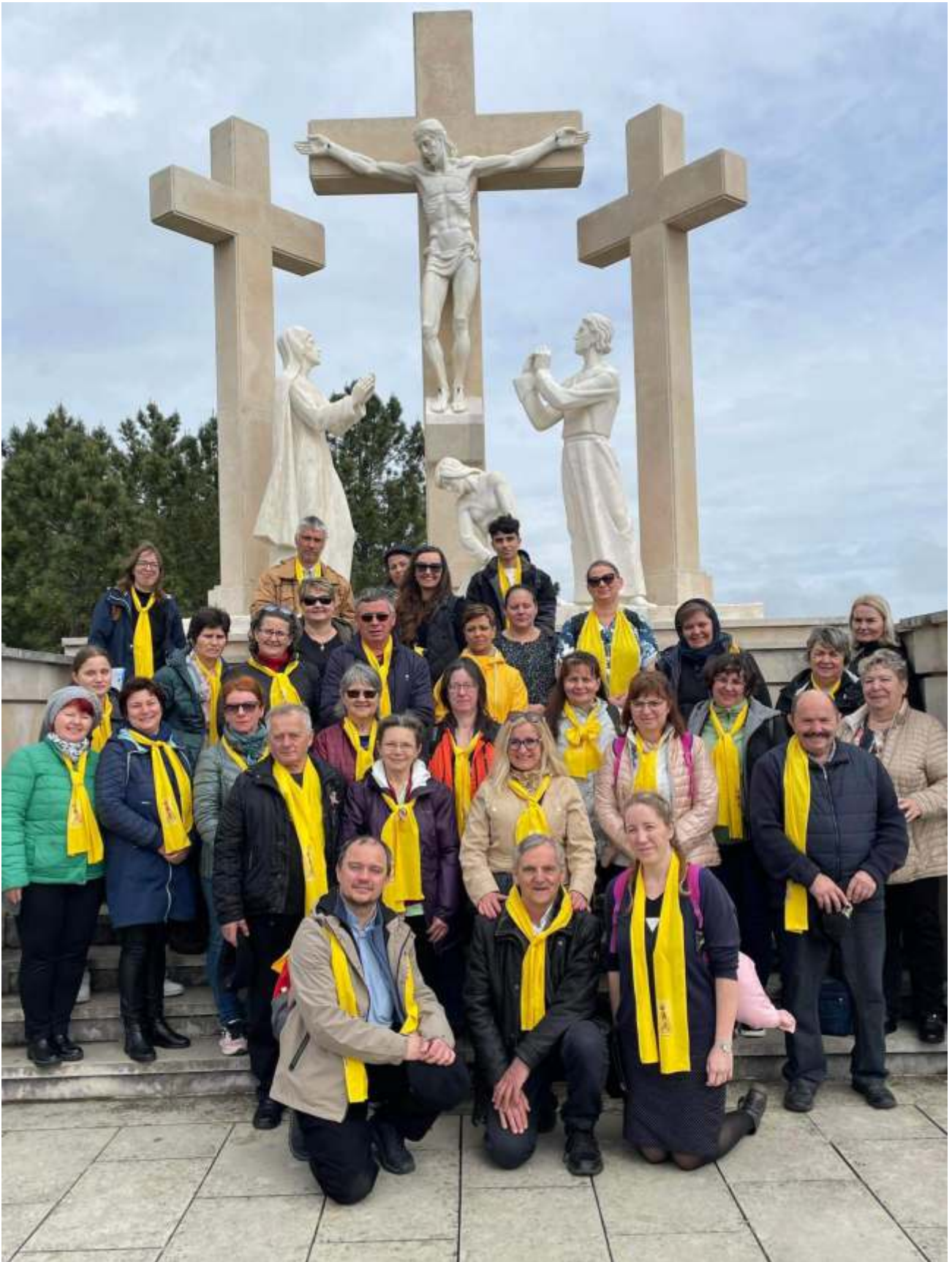
A fatimai magyar keresztútnál 2024.03.16