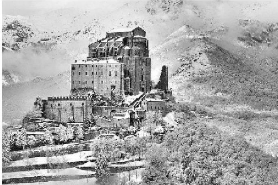
Olaszország, Piemont, Sacra di San Michele apátság

már a gallok idején erős miszticizmus hatotta át, mígnem 709-ben az arkangyal megjelent Szent Aubert-nek, az Avranches-i püspöknek, és azt kérte tőle, hogy építsen templomot a sziklára. A munkálatok elkezdődtek, de az apátság csak 900-ban, a bencés szerzetesek idején épült föl.