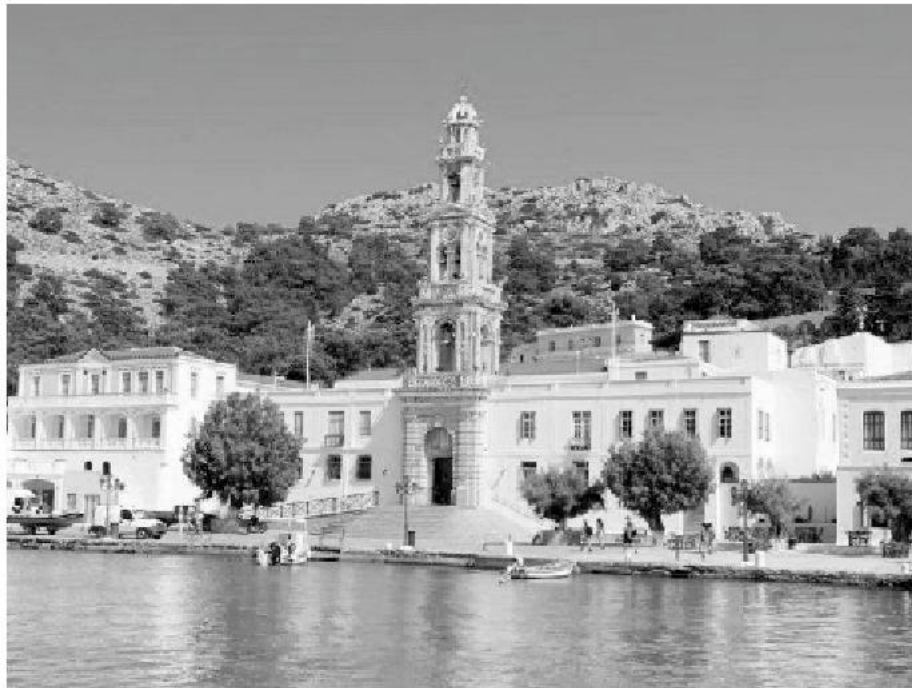
Görögország, Symi szigete, Panormitis monostor

Jézusunk! Hálásak vagyunk, hogy itt lehetünk szent színed előtt és rendületlenül bízunk Szent Mihály értünk való küzdelmeiben! Köszönjük ezt Neked! Mennyei Atyánk, bizalommal kérünk, fogadd el a Szentlélek erejében és szeretetében Magyarországnak ezt a felajánlását Szent Mihály Arkangyalnak a végső idők e nagy harcában. Amen.”