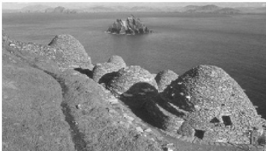
Írország, Skellig Michael kolostora

Mintha vonalzóval húzták volna meg az Európát átszelő egyenes vonalat Írország és Izrael között. Sőt, a három legfontosabb kegyhely – a franciaországi Mont Saint Michel, az olaszországi Susa-völgyben a Szent Mihály-szentély és a garganói Monte Sant’Angelo szentélye – azonos távolságban is helyezkedik el egymástól. És ha ez nem volna elég, a vonal tökéletesen illeszkedik a naplemente vonalához a nyári napforduló napján.