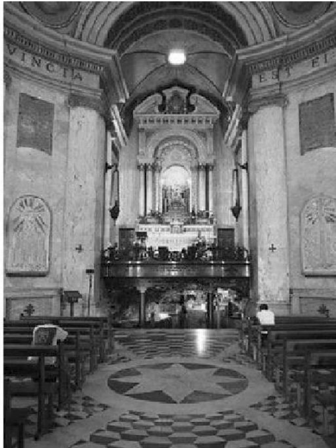
Izrael, Kármel hegyi monostor

reggel kimenni a tengerpartra, ahol a pópa türelmesen meghallgatja az álmát, és megmagyarázza, mit üzent neki az arkangyal.