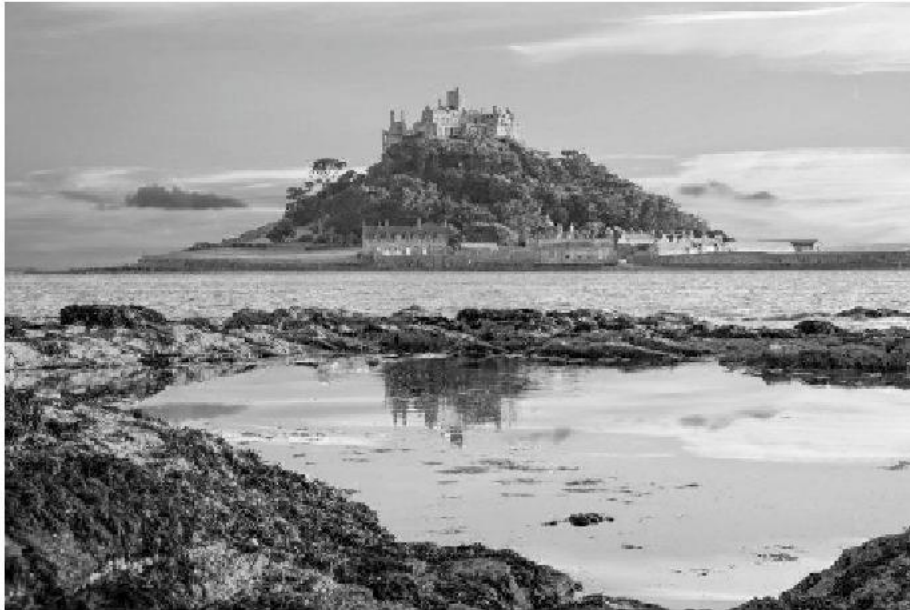
Anglia, Saint Michael's Mount kolostor

A vonal ezután délnek veszi az irányt a következő állomásig, mely Angliában, a Saint Michael's Mount, mely Cornwall egy kis szigetén épült, mely csak apály idején közelíthető meg.