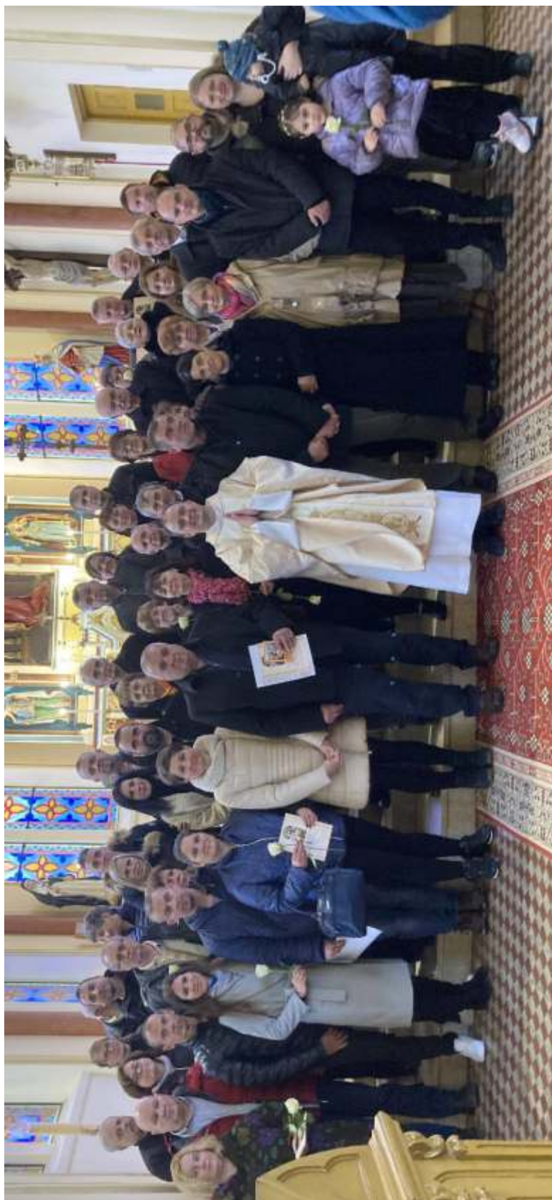
Jubiláns Házaspárok megáldása 2024.02.11