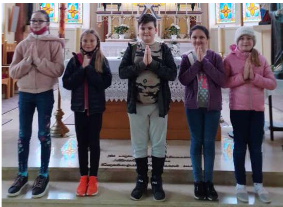
Pünkösti elsőáldozó jelöltek. (4/a, a karantén miatt...)