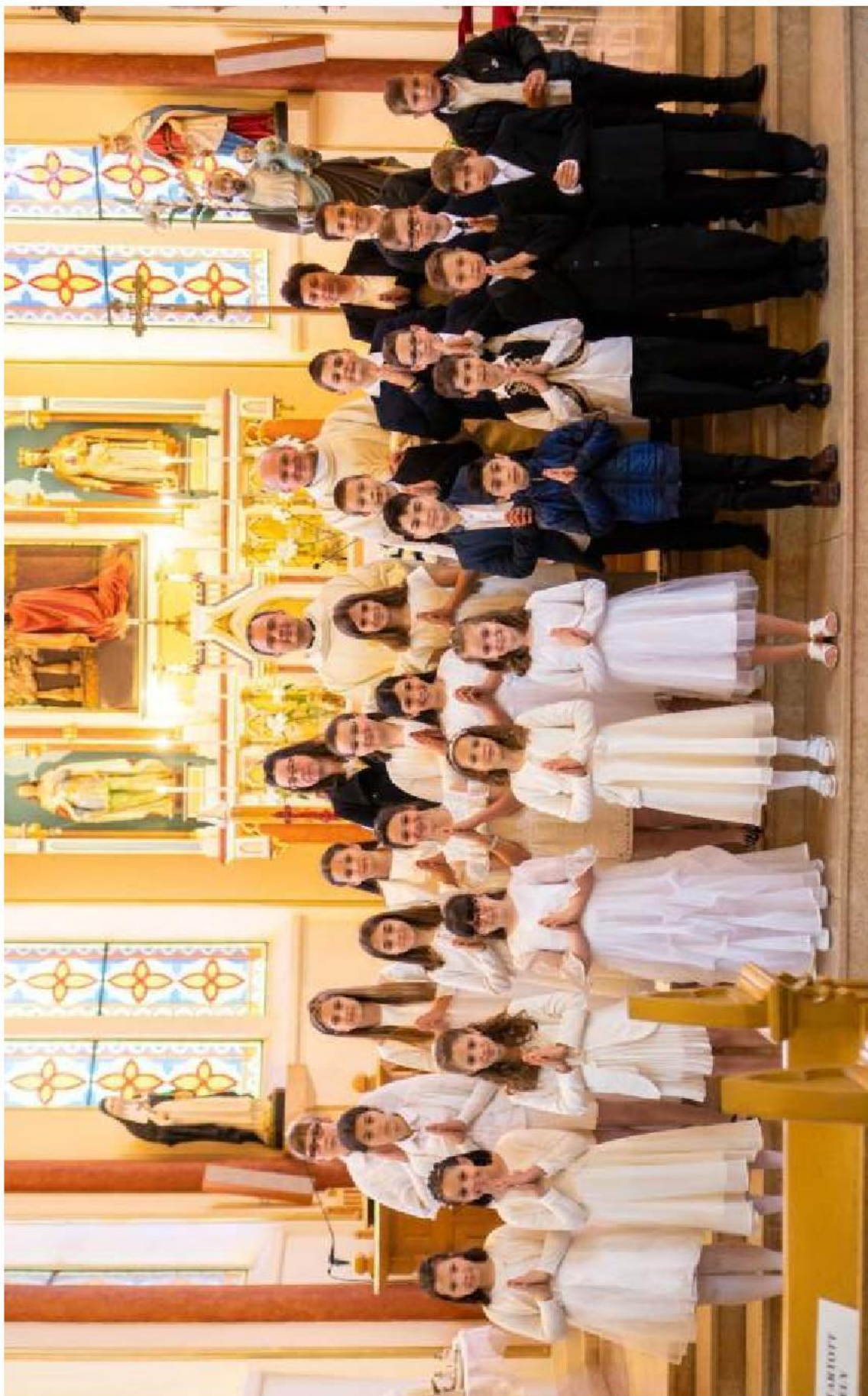
Jézus úgy ad nekünk táplálékot az Oltárszentségben, hogy abban nem más, hanem önmaga van benne. Önmagát áldozza nekünk. Szeretettel gratulálunk az elszáldozóinknak és az Őket felkészítő atyáknak és hitoktatóknak. Isten áldása és szeretete kísérje életüket.