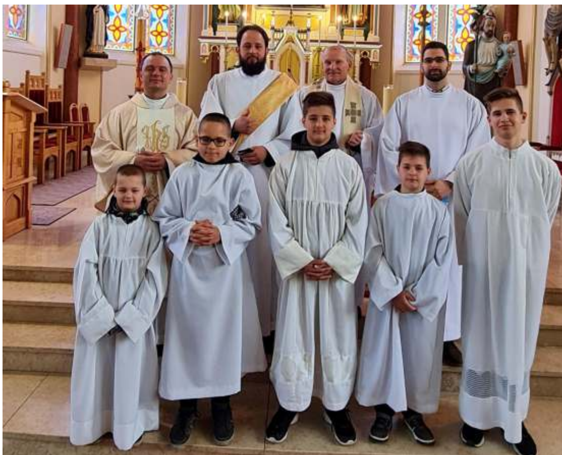
2021. ápr. 25-én, Húsvét 4. Vasárnap - Hivatások vasárnapja