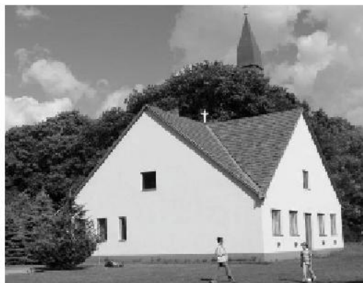
a Szent Imre Otthon

Számomra is meglepő volt, milyen sokan reagáltak rá, megosztották ismerőseiknek, többen írtak megemlékező kommenteket.