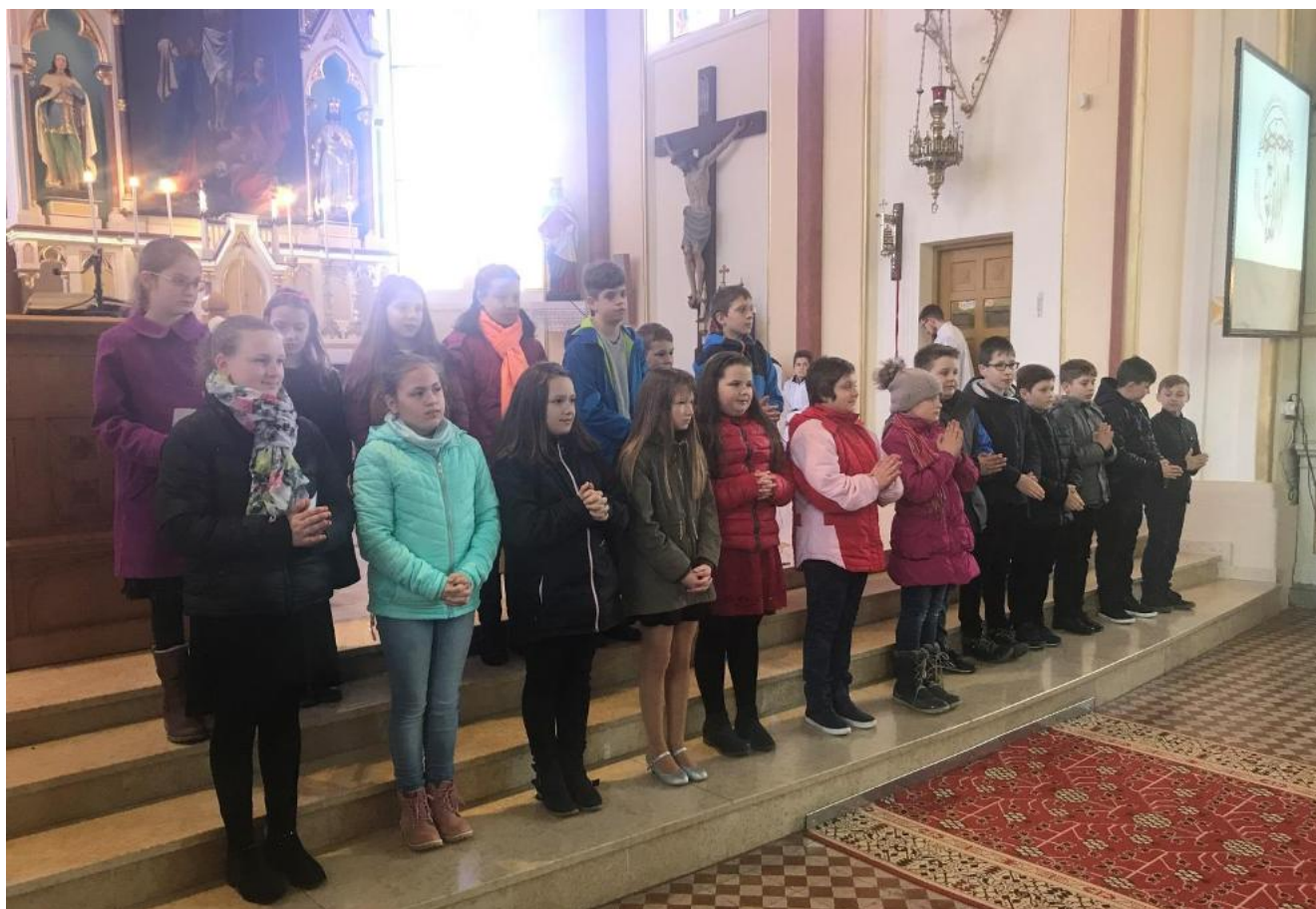
Március 11-én a 9-órás Szentmise keretében kerültek bemutatásra a leendő elsőáldozók.