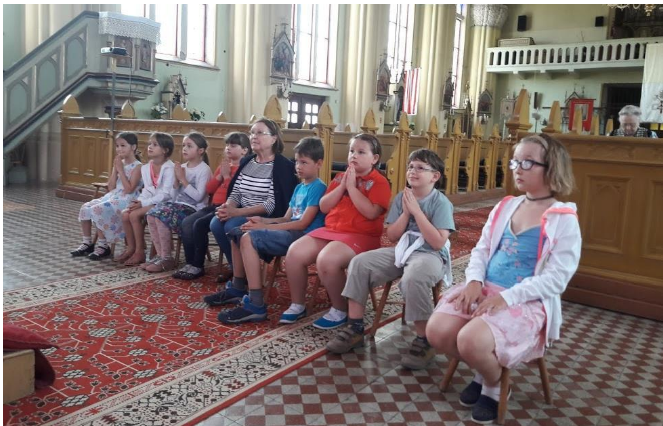
Uram jó nekünk itt lenni... (Szentségimádás)