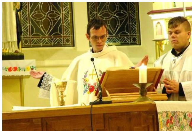
2017.11.25. Krisztus Király, Szentségimádás és Szentmise