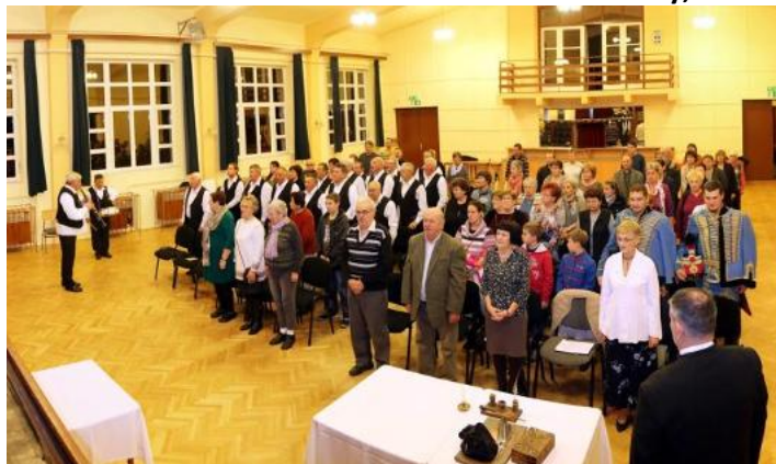
160 éves az újjáépített Kerekegyháza