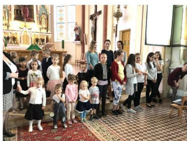
Óvodások is énekel szolgáltak