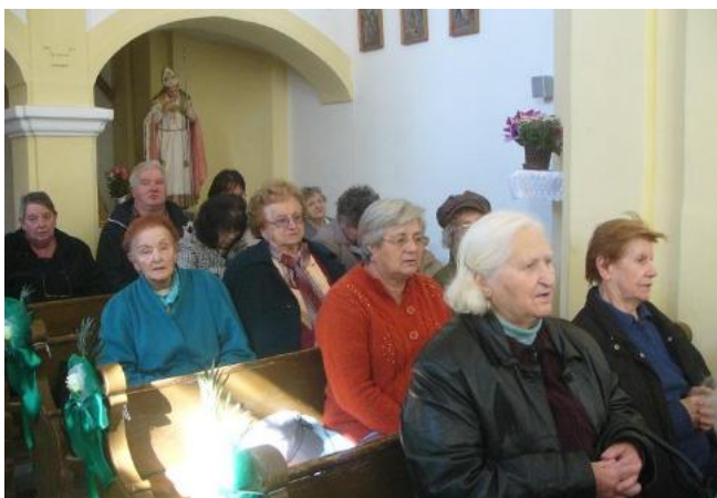
2017.10.07. Pásztó, záródoklat a könnyező Szűzanya szoborhoz