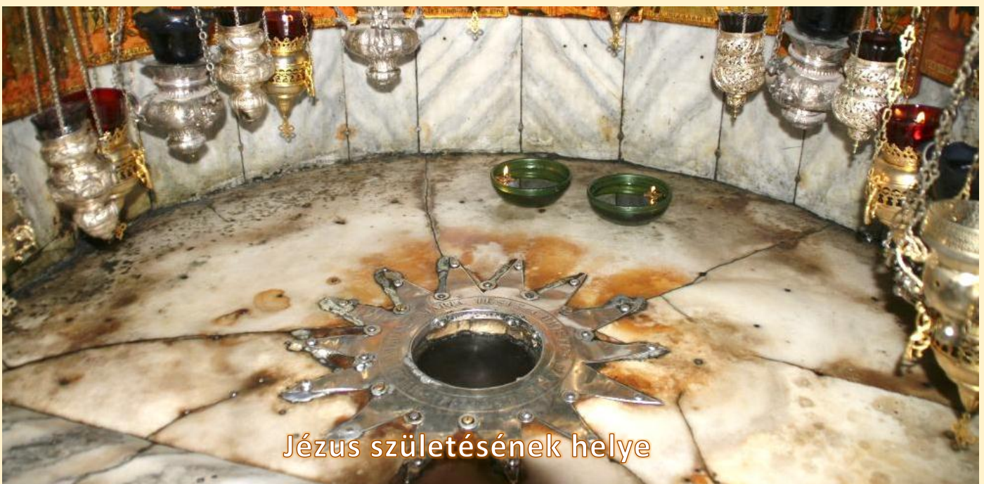
Jézus születésének helye

„Te pedig, efrátai Betlehem, bár a legkisebb vagy Júda nemzetségei között, mégis belőled származik az, aki uralkodni fog Izráelen.” (Mt.2,6)