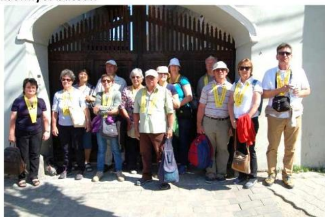
Részvétel a Csíksomlyói búcsún