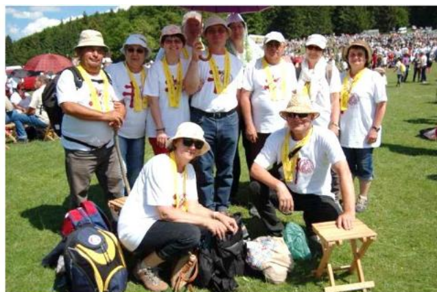
Részvétel a Csíksomlyói búcsún