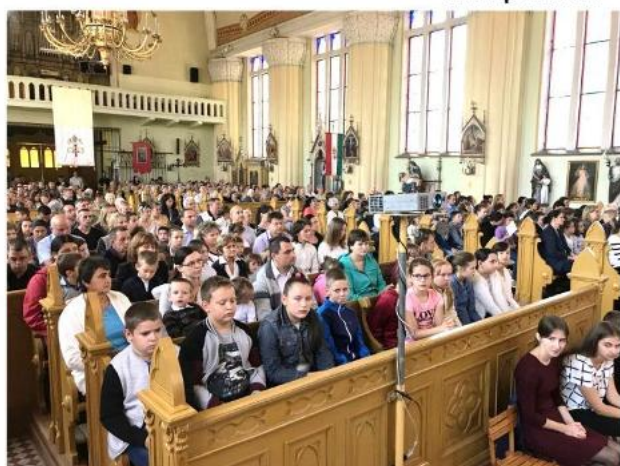
„Telt ház” a tanévnyitó Szentmisén