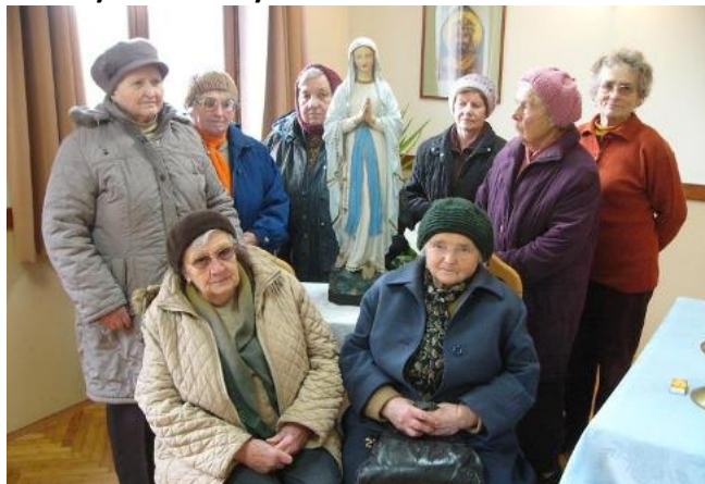
10 éves a Szent Erzsébet imakör