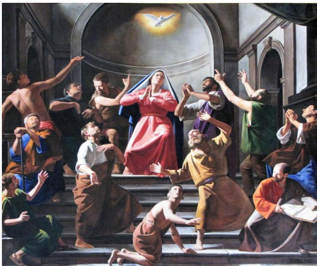
A festmény Kisléghi Nagy Ádám alkotása, melynek címe: A Szentlélek eljövetele.

„Kérem-e az Úrtól azt a kegyelmet, hogy a szívem nyitott legyen?” „Kérem-e az Úrtól, hogy meghalljam a Szentlelket, sugalmazásait és mindent, amit a szívemnek mond, hogy a keresztény életben járjak?”