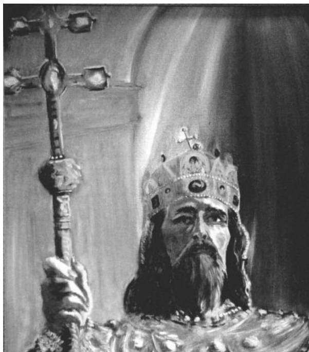
Detre György: Szent István